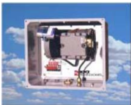
Kompressorsæt for Jet-Clean (Option)

Rækværks- monteret med kvikrelease beslag. (Option)