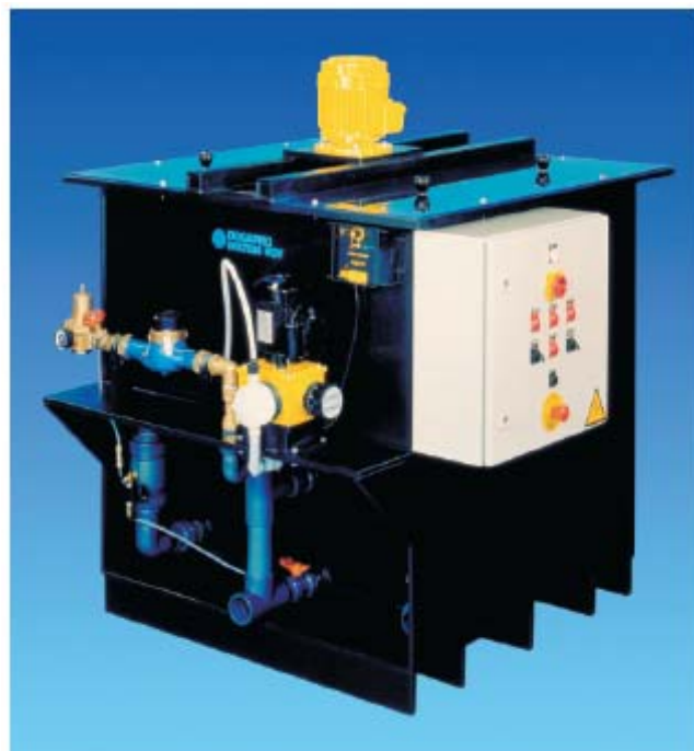
Polypack® AE 1500